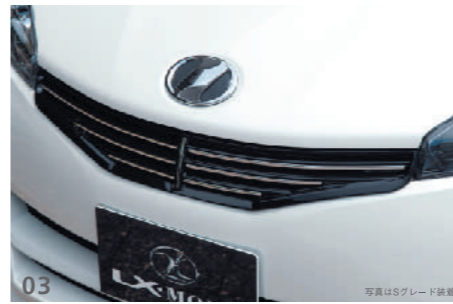
03 LXブラックフロントグリル クロームモールをインサートし高級感と品質感を演出。元祖LXグリル縦フィンモデルの復活です。