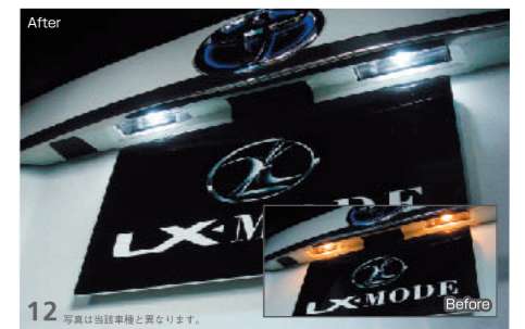
12 LX プレミアムLEDランプ(ライセンスバルブ) リアのライセンスプレートを照らすLEDライセンスバルブ。消費電力の少ないLEDによりバッテリーへの負担も低減。