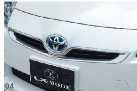
04 LXクロームグリルガーニッシュ 純正グリル開口部をメッキ化することで高級感を演出。