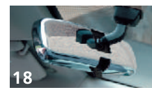
18 LXクロームルームミラーカバー ■純正インナーミラーの上から両面テープにて固定 ■ワングレード上の高級感をクロームメッキにて表現 ■ABS樹脂製 ■16色設定