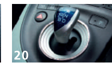
20 LXラインストーンリング(シフトゲート) ■シフトゲート外周部にストラス&スワフ ■フロアスキーコンポーネントを散りばめ高級感を演出 ■クロームメッキ処理リング ■真鍮削り出し製