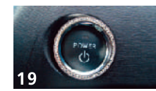
19 LXラインストーンリング(エンジンスタート) ■スタートスイッチ外周部にストラス&スワフ ■フロアスキーコンポーネントを散りばめ高級感を演出 ■クロームメッキ処理リング ■真鍮削り出し製