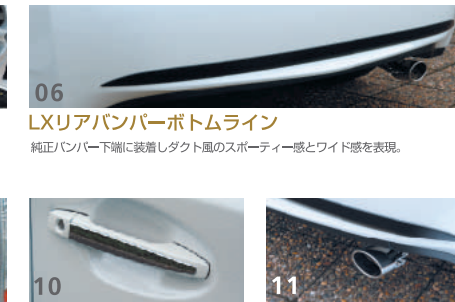
06 LXリアバンパーボトムライン 純正バンパー下端に装着しダクト風のスポーティー感とワイド感を表現。