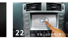
22 LXナビモニタープロテクトシート ■ナビ画面のキズを防止するハードコート処理フィルム ■高い遮光性とタッチパネル対応の適度な厚み ■純正ナビ専用サイズ ■書き上りを防止するコーナーカットを採用 ■右上隅にLX-MODEロゴ