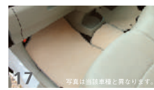
17 LXカラードフロアマット ■車種専用設計によるフィット感を表現 ■純正インナーミラーの上から両面テープにて固定 ■ワングレード上の高級感をクロームメッキにて表現 ■ABS樹脂製 ■16色設定