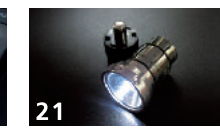
21 LXシガーライターソケット(保護LEDライト) ■LX-MODEロゴプレート付属 ■通常時はシガーライターに差し込み充電(ブルーに光ります) ■ソケットから外しレンズをひねると白色LEDランプが点灯 ■専用ケース付属